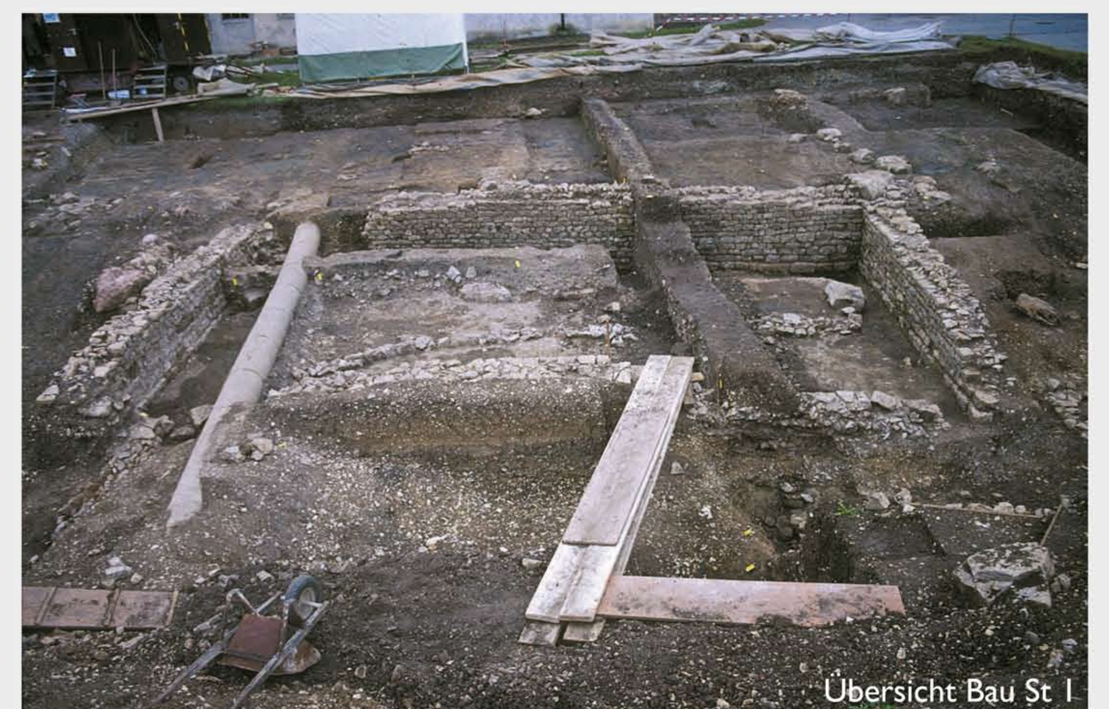
Übersicht Bau St 1