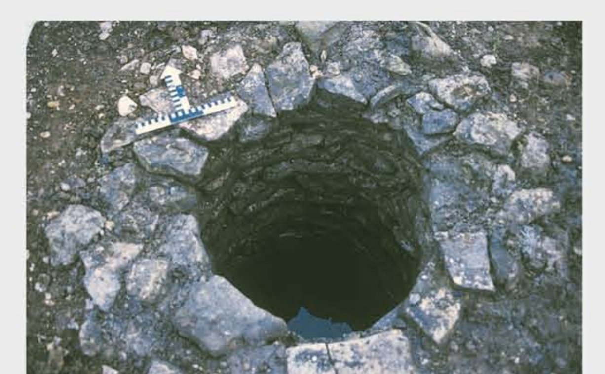
Sodbrunnen südlich des Baus St 1