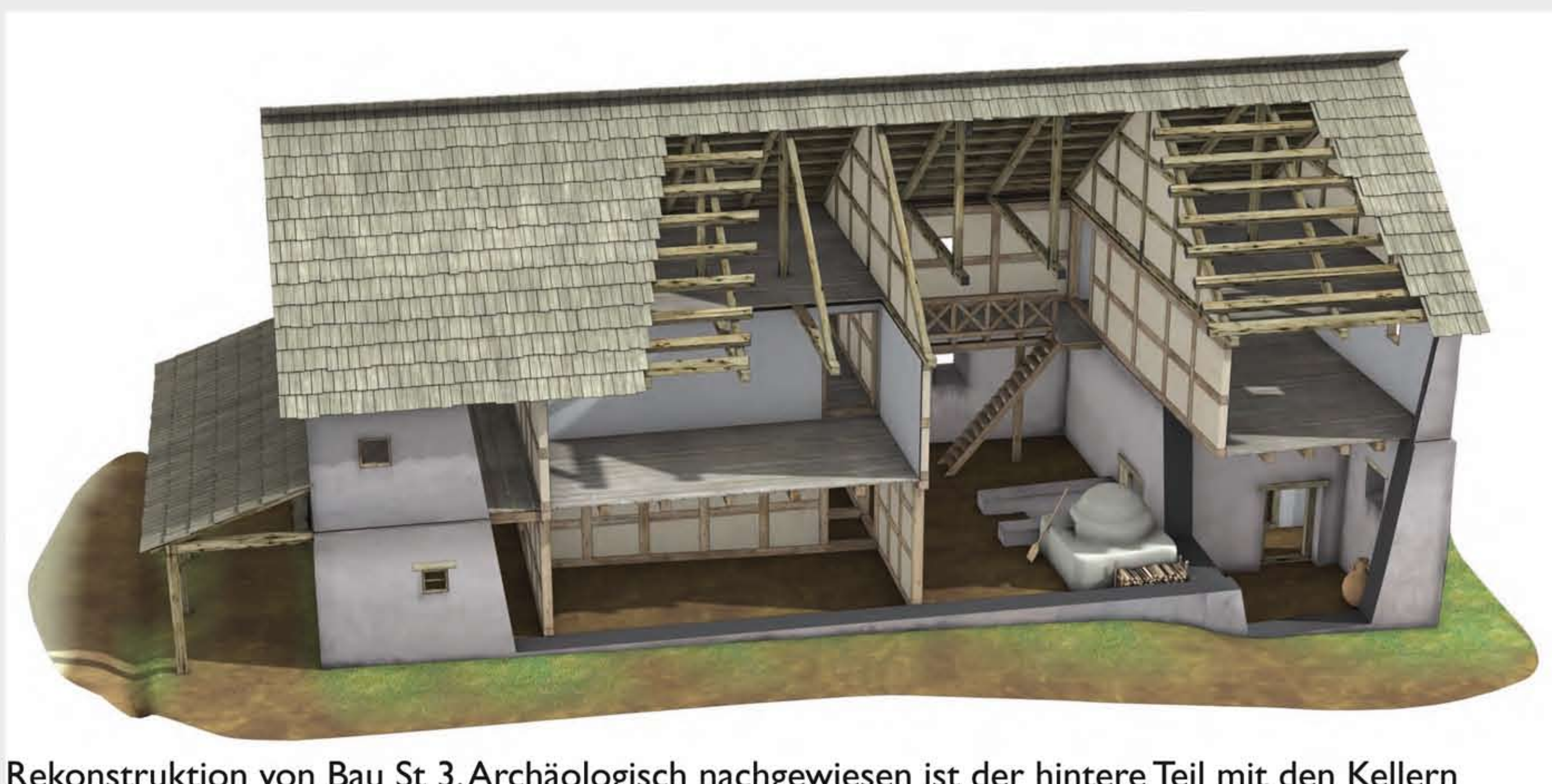
Rekonstruktion von Bau St 3. Archäologisch nachgewiesen ist der hintere Teil mit den Kellern

Nach einem verheerenden Brand gestaltete man im frühen 2. Jh. n. Chr. das ganze Gelände um. Bis auf Bau Ho 2, der anscheinend das Feuer unbeschadet überstanden hatte, wurden alle Holzbauten abgerissen und ersetzt. Gleichzeitig begann man den Zwerenbach durch umfangreiche Erdbewegungen ein weiteres Mal nach Westen abzurängen. Dank des so neu gewonnenen Baulandes konnten die neuen Häuser um rund 3 m nach hinten verlängert werden. Diese besaßen nun teilweise gemörtelte Steinmauern und waren im hinteren Gebäudeteil mit leicht in den Hang eingetieften Kellern ausgestattet. Da heute oft nur mehr wenige Steinlagen des aufgehenden Mauerwerks erhalten sind, lässt sich nicht sicher sagen, ob nur die Fundamentsockel oder ganze Geschosse und Gebäudeteile in Stein errichtet waren, während die restlichen Aufbauten aus Holz und Lehm erstellt wurden. Üblicherweise dürfte aber eine Mischtechnik aus Stein und Holz/Lehm zum Einsatz gekommen sein. Während die älteren Gebäude allenfalls nur einstockig waren, darf für die jüngeren dank der stabilen Fundamentierung ein zweistöckiger Aufbau angenommen werden.