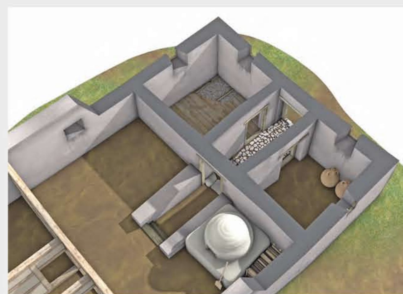
Jüngerer Kellerabgang mit Pflasterung

Zu einem späteren Zeitpunkt wurde diese Holzstiege ersetzt, vielleicht weil sie morsch geworden war. Während die oberen Stufen herausgerissen wurden, beließ man die unteren zwei im Boden und überdeckte sie mit einer Erdrampe. Der Durchgang zum Keller wurde nun mit einer Sandsteinschwelle ausgestattet und der anschließende Gangboden mit einer Pflasterung aus flachen Kalksteinen belegt.