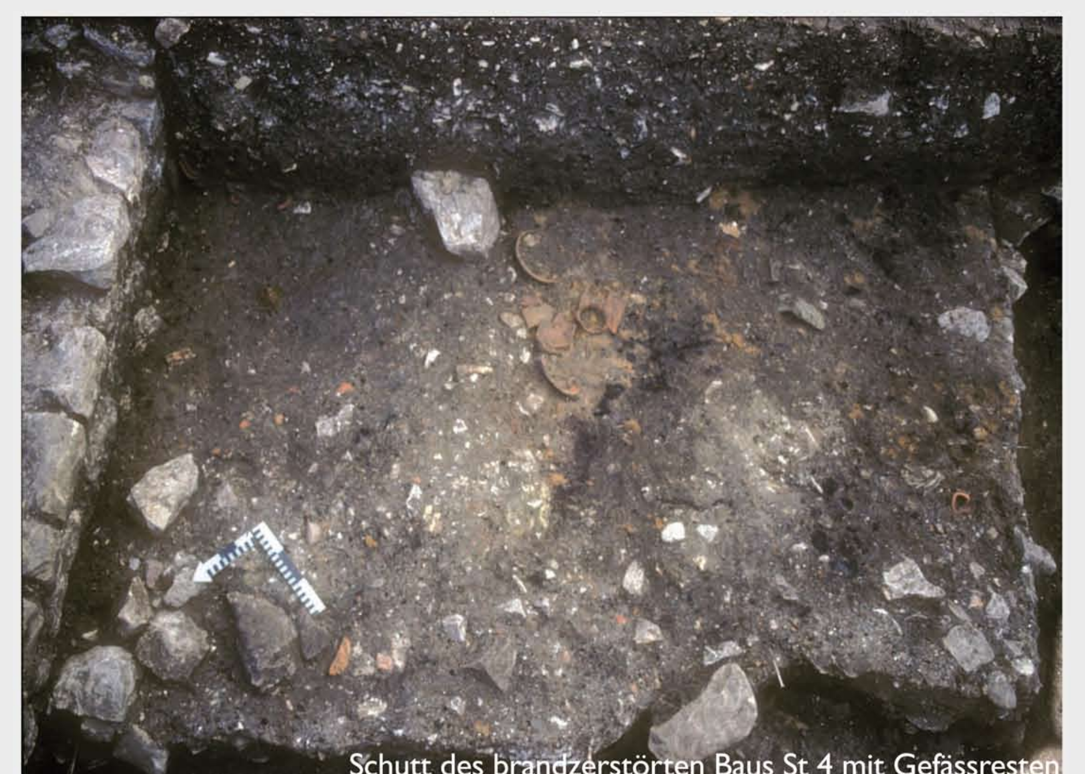
Schutt des brandzerstörten Baus St 4 mit Gefässresten