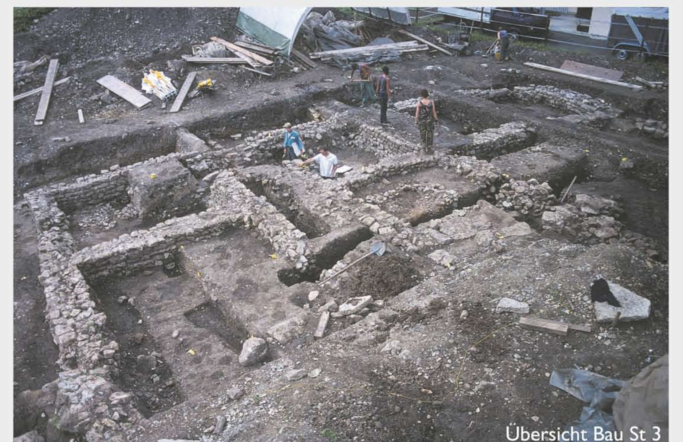
Übersicht Bau St 3