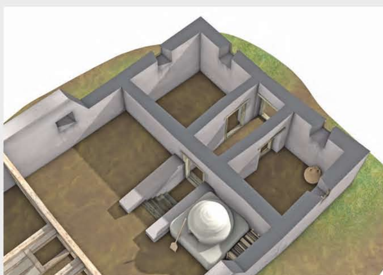
Älterer Kellerabgang mit Holzstiege

Im Laufe ihrer Benutzung erfuhren die Häuser verschiedene Umbauten. So besaß der Keller des Baus St 3, dessen Reste hier restauriert vorliegen, ursprünglich keinen tiefer gelegten Zugang, sondern war vom östlich anschließenden, rund 1 m höher gelegenen Raum her anscheinend nur über eine Holzstiege erreichbar. Später wurde dann ein abgesenkter Kellerabgang angelegt und die Türöffnung durch die östliche Kellermauer tiefer gelegt. Gleichzeitig verlängerte man den Gang mittig durch den Keller, wobei die zwei neu entstandenen Kellerräume über seitliche Zugänge erschlossen wurden. Über eine weitere Türe am Ende des Ganges gelangte man in den Hinterhof. Fünf Holzstufen, die seitlich in die Gangmauer verankert waren, führten von den höher gelegenen, ebenerdigen Räumen im Osten in den Keller.